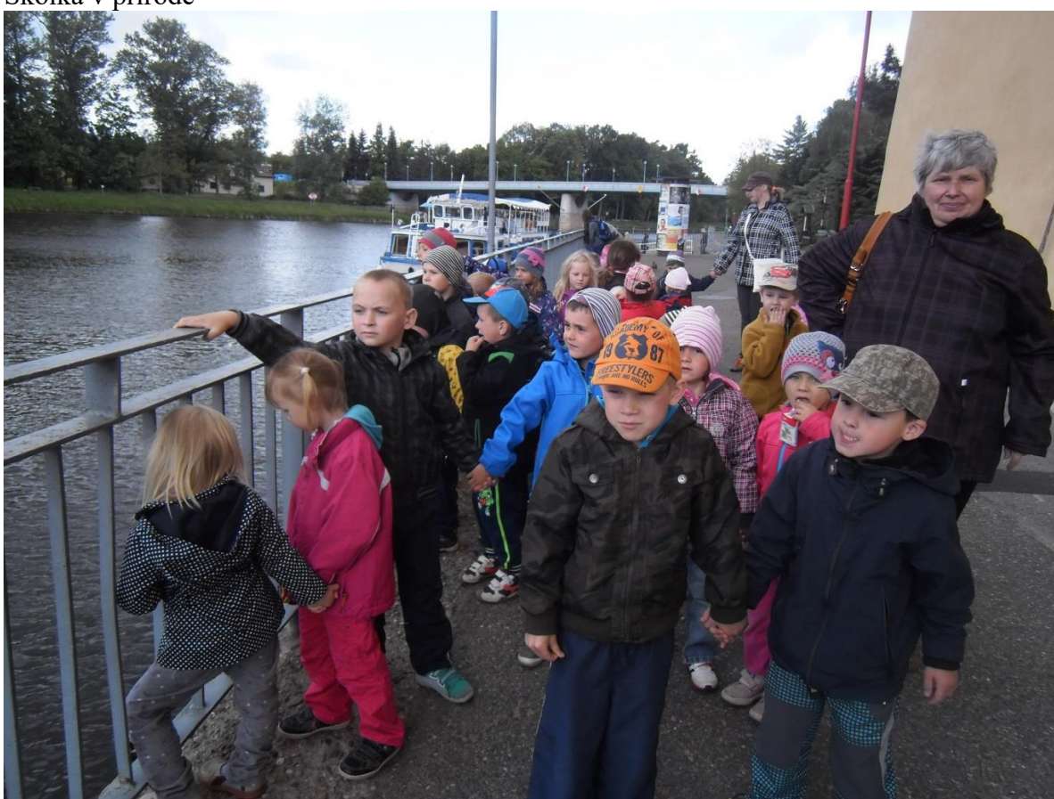
Výlet parníkem po Labi