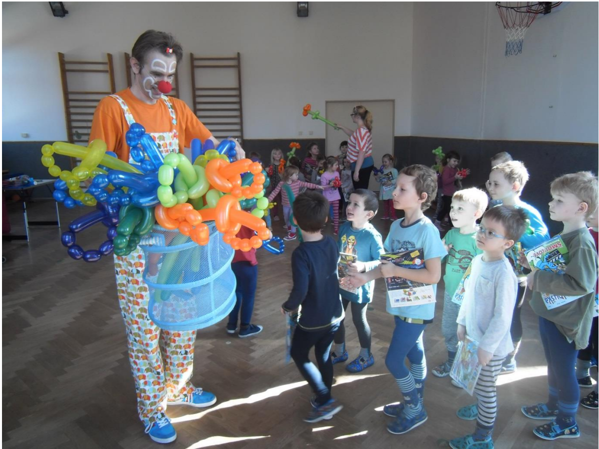
Klaun v mateřské škole