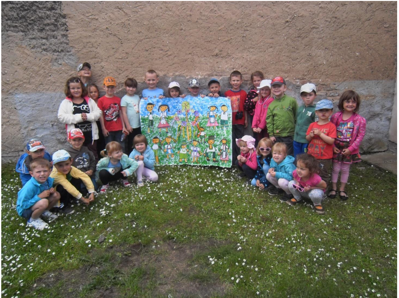
Máje – jak jsme tancovali