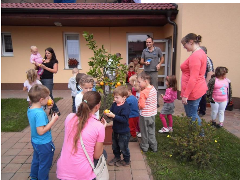
Vystoupení v Senior parku