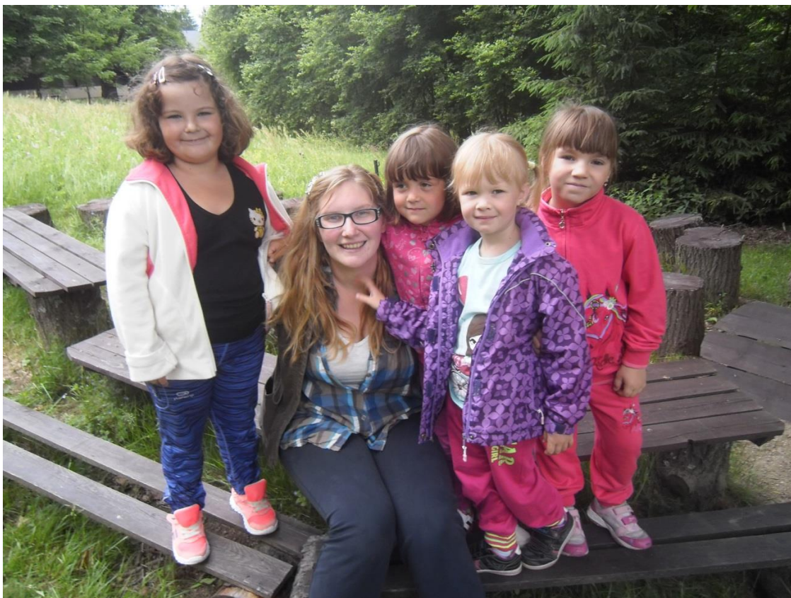
Školka v přírodě